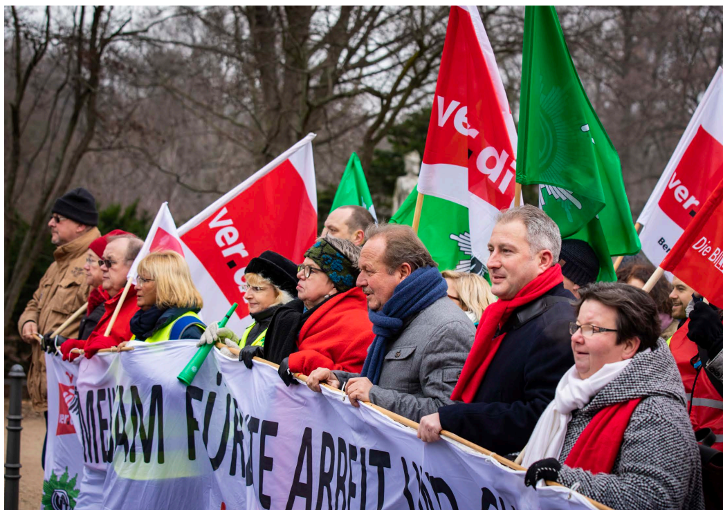
Kolleginnen und Kollegen demonstrieren vor Beginn der Verhandlungen in Berlin für ihre Forderungen.

Wir erinnern uns: Schon seit 2015 nehmen Bund, Länder und Kommunen mehr ein, als sie ausgeben. Für 2017 wurde ein Überschuss von 61,9 Milliarden Euro erreicht.